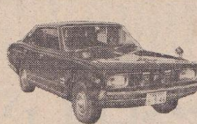
47年 セドリック4ドア HTカスタムDX マルーン、クーラー付、検55年11月 47万円