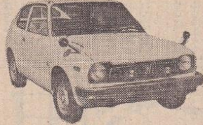
48年 シビック1200GL 黄、検56年11月 28万円