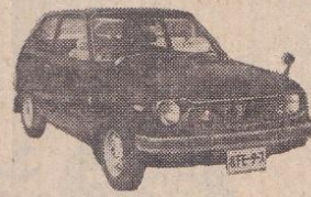
50年 シビック1200GL グリーン、検2年取 36万円