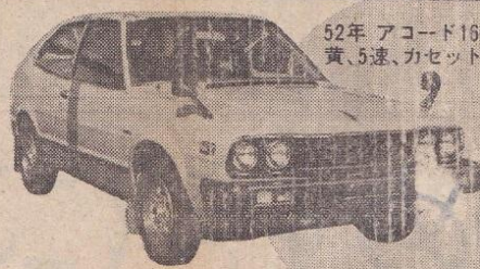
52年 アコード1600LX5 黄、5速、カセット付、検2年取