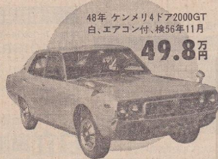
48年 ケンメリ4ドア2000GT 白、エアコン付、検56年11月