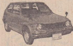
48年 シビック1200GL 赤、検2年取 28万円