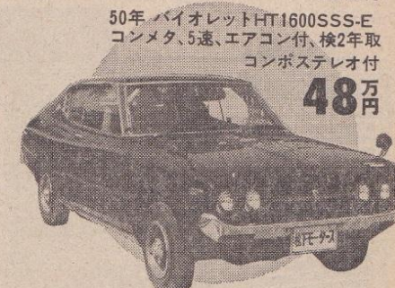
50年 バイオレットHT1600SSS-E コンメタ、5速、エアコン付、検2年取