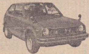
48年 シビック1200GL 赤、検56年11月 28万円