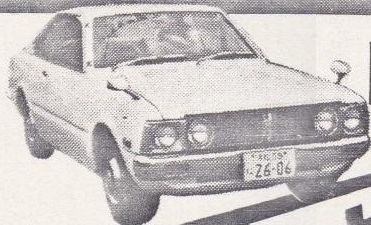
49年 コロナHT1800DX 白、A-C付 検55年12月