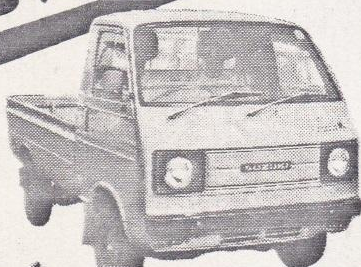
81年 キャリートラック ワイド550cc、ブルー 検2年取