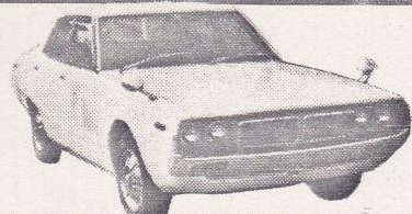
88年 ケンメリ4ドアGT 白、A-C付 検2年取