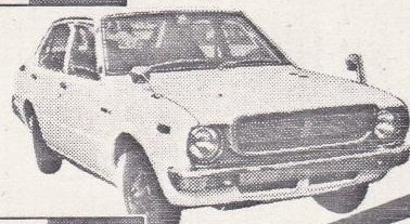
80年 コローラ1400 4ドアDX、白 検2年取