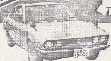
88年 117クーペ1800XC シルバー、A-C付、AT 検55年2月